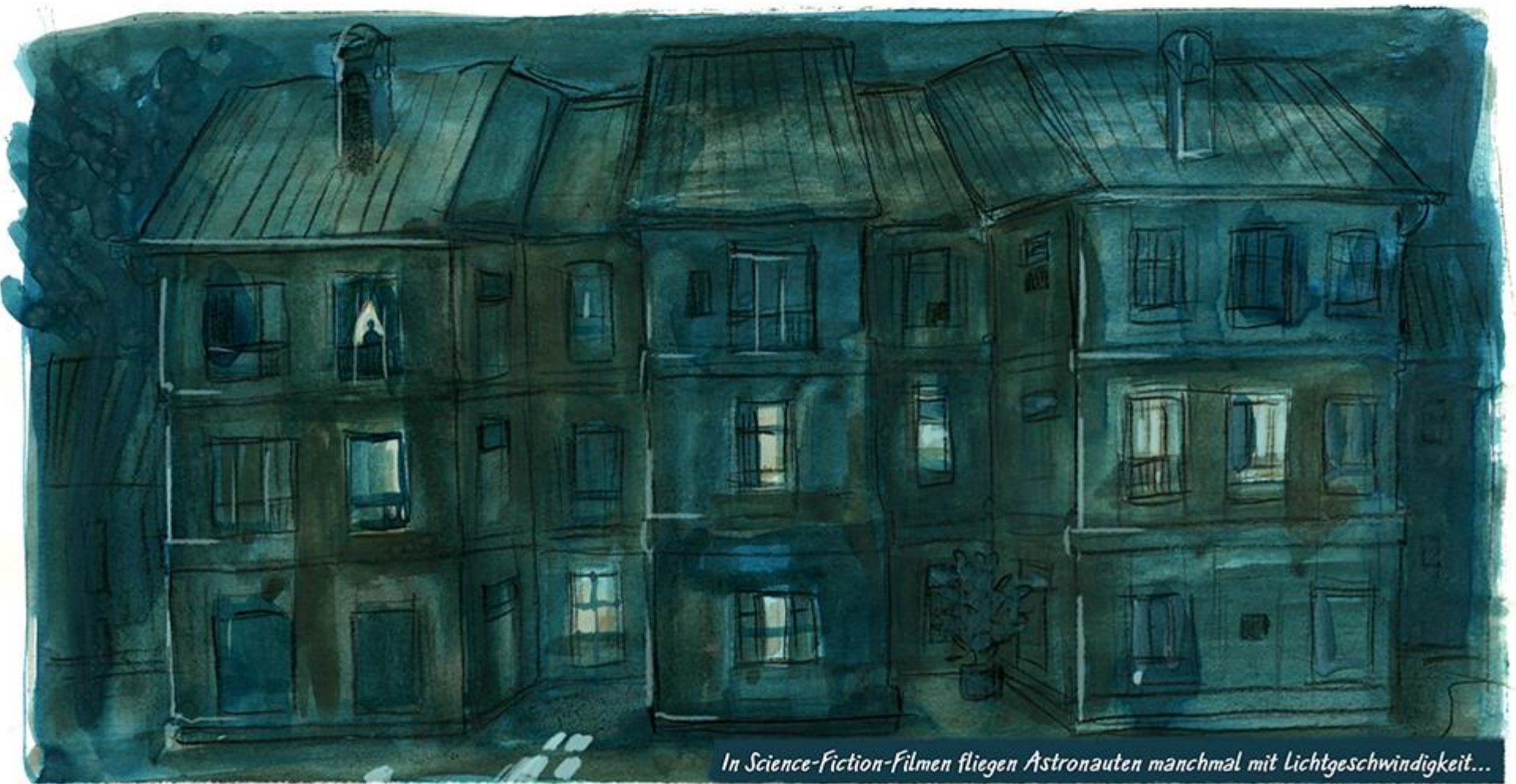
In Science-Fiction-Filmen fliegen Astronauten manchmal mit Lichtgeschwindigkeit...