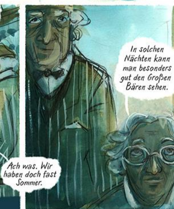
... ohne etwas tun zu können?

In solchen Nächten kann man besonders gut den Großen Bären sehen.